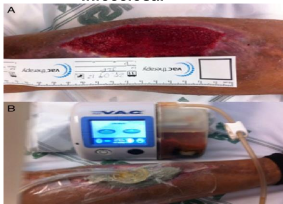
Figura 3: Aplicação de terapia por pressão negativa em uma lesão infecciosa.